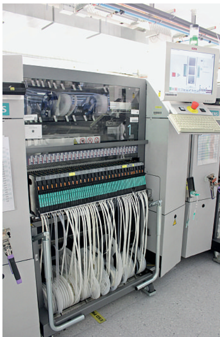
SMD-Bestückungsautomat mit digitalen Bauelemente-Feedern.

Als EMS-Dienstleister muss Zollner mit weltweit 20 Standorten das Thema Rückverfolgbarkeit als Unternehmensgruppe gesamtheitlich lösen, um den Kundenanforderungen entsprechen zu können. Da sich einzelne Werke auch gegenseitig beliefern, hat Zollner sich bereits sehr früh für ein einheitliches IT-Tool, die Datenbank Manufacturing Executing System (MES), entschieden. Diese ist eng mit